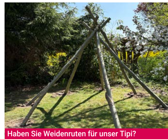
Haben Sie Weidenruten für unser Tipi?