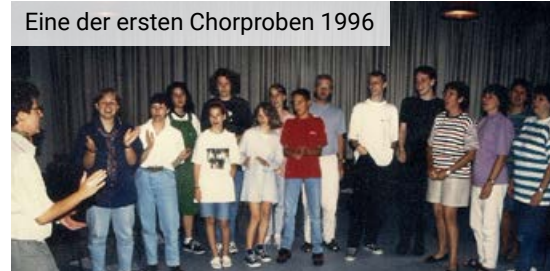
Eine der ersten Chorproben 1996