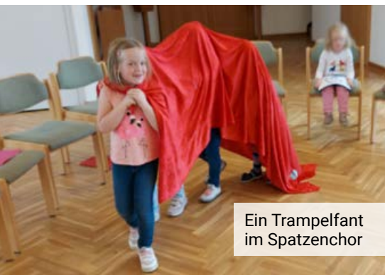
Ein Trampelfant im Spatzenchor