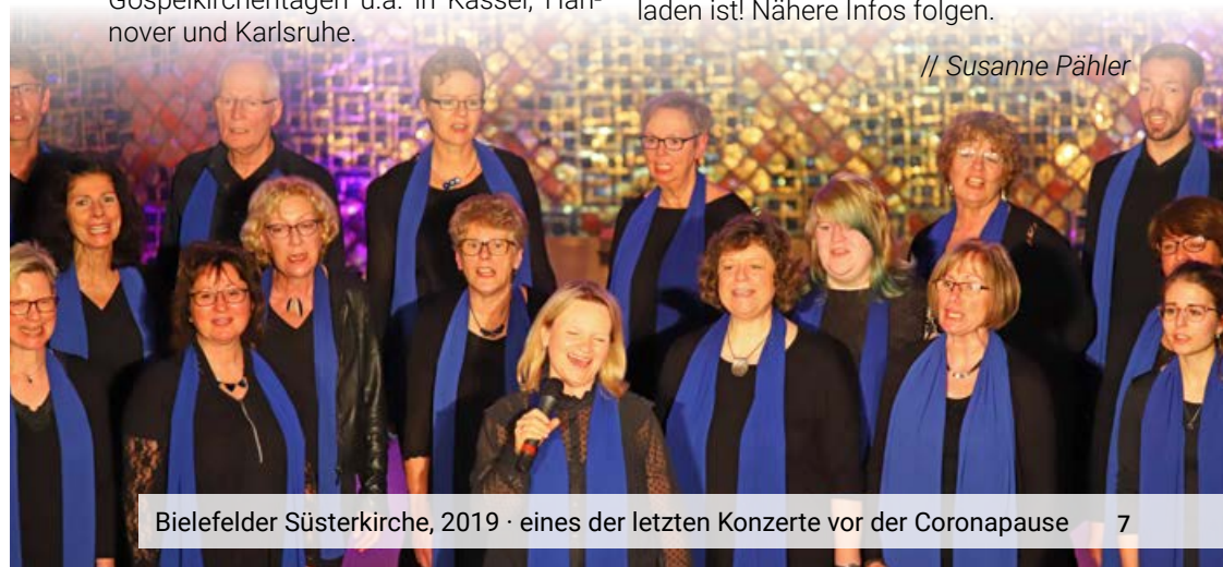
Bielefelder Süsterkirche, 2019 · eines der letzten Konzerte vor der Coronapause